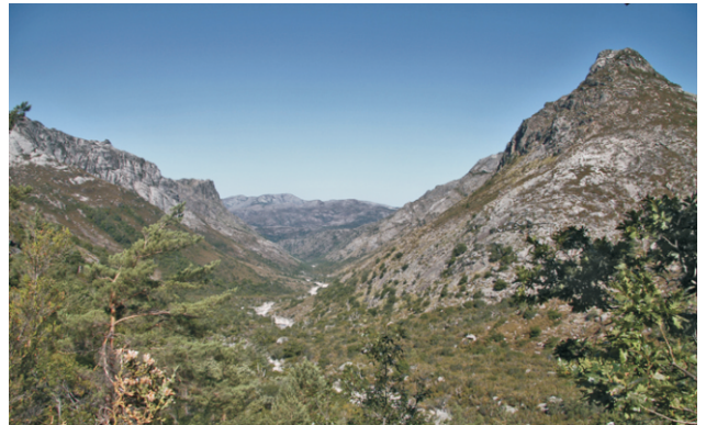
Vista do val do río Homen. Ao fondo a serra de Santa Eufemia.

A xente con gañas de aventura pode tentar cruzar a serra por Portela da Amoeira, buscar o enlace coa ruta da mina das Sombras e baixar por Vilameá ou por un camiño que volve a preto do posto fronteirizo.