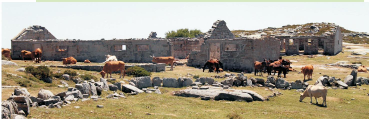
Gando ao pé dos edificios da mina dos Carríns. Nestas minas extraíase volframio, estaño e molibdeno. Comezaron a funcionar en tempos da II Guerra Mundial e pecharon en 1958.