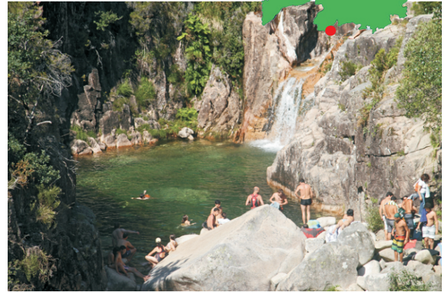
Poza e ferverza no río Homen ao pé da ponte de San Miguel

Unha ruta que discorre por terreos do parque Nacional Peneda-Gerês de Portugal remontando o curso do río Homen (afluente do Cávado) ata os cumes da serra. De gran interese xeolóxico, paisaxístico e biolóxico. Poderemos gozar de espectaculares vistas do val glaciar do río Homen e dos cumes da serra do Xurés-Gerês, apreciar as distintas formas de erosión glaciar e fluvial, unha gran variedade de formacións rochosas e especies animais e vexetais propias da zona.