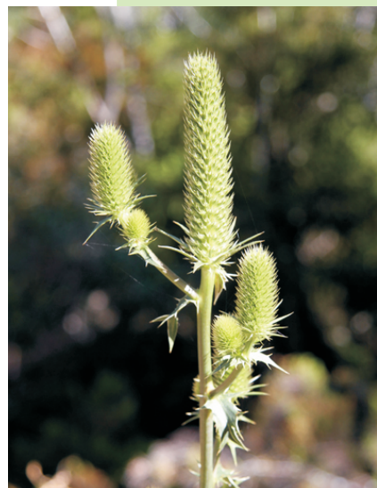
Cardo do Xurés ( Eryngium duriaei sbp. juresianum ), endemismo das serras do Xurés-Gerês, considerada en perigo.