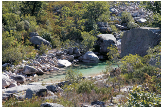
Unha das numerosas pozas que se atopan no curso do río.