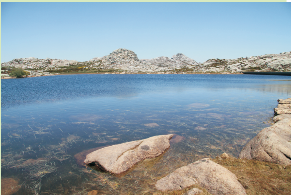
Lagoa dos Carrís, formada artificialmente nas nacentes do río do Penedo para proporcionar auga ás minas.