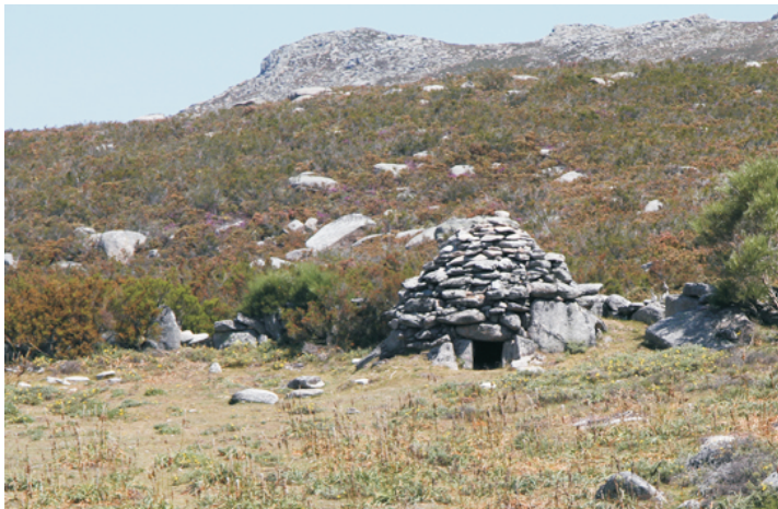
Chivana, refugio dos pastores da serra.