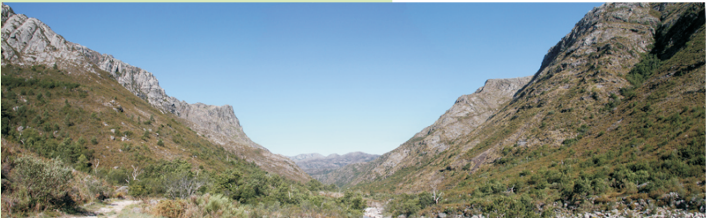
Panorámica na que se aprecia a típica forma en U do val glaciar do río Homen.