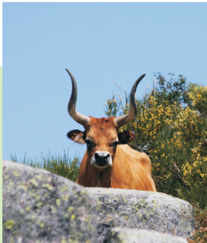
Vaca típica da serra do Gerês